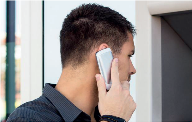
У лже-минеров мотивы могут быть совершенно разными.

Что касается личности звонившего, то она сразу была установлена, сейчас полиция